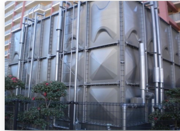
4m×5m×3.5m (70tタンク) サスコーティング: 690万円 貯水槽更新工事: 1700万円-2200万円