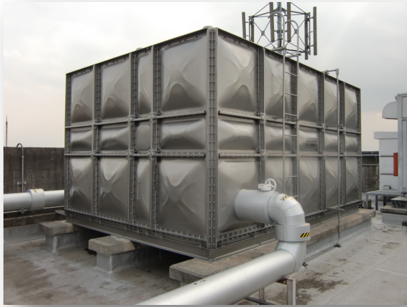
3.5m×5m×2.5m (45tタンク) サスコーティング: 510万円 貯水槽更新工事: 1100万円-1600万円