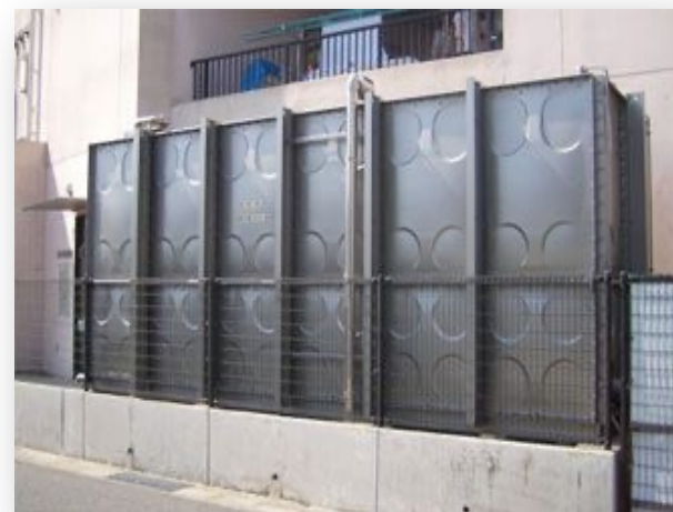
2.5m×6m×2.5m(30tタンク) サスコーティング:400万円 貯水槽更新工事:800万円-1200万円