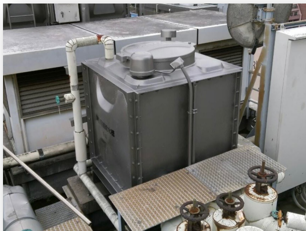
1m×1m×1m(1tタンク) サスコーティング:60万円 貯水槽更新工事:100万円-150万円