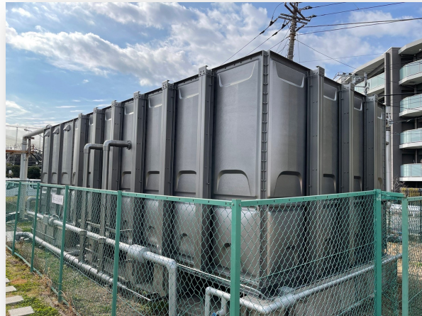
4m×10m×3m (120tタンク) サスコーティング: 1040万円 貯水槽更新工事: 2500万円-3000万円