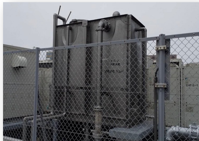
1m×2m×2.5m(5tタンク) サスコーティング:130万円 貯水槽更新工事:200万円-250万円