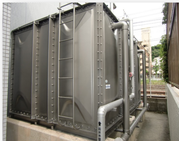
2.5m×3m×2m(15tタンク) サスコーティング:250万円 貯水槽更新工事:400万円-500万円