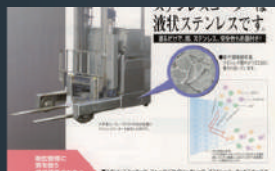
コマツリフト株式会社 様 / フォークリフト