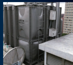
埼玉県/マンション