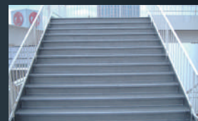
株式会社ルミネ 様 / 非常階段